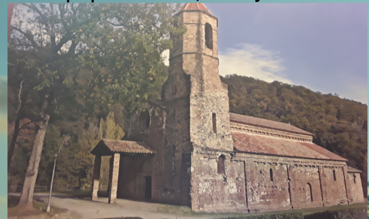
EL PONT MEDIEVAL

És un lloc religiós, es va construir el segle XII esta situat a prop del riu Fluvià, a Sant Joan les Fonts.