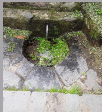
FONT DE LES MULLERES