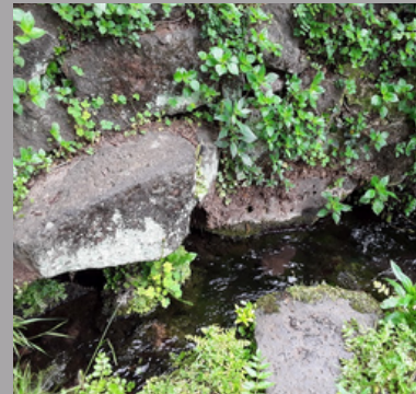
FONT DE FONTFREDA