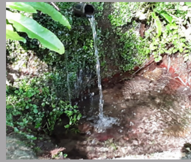
FONT DE CAN XERVANDA