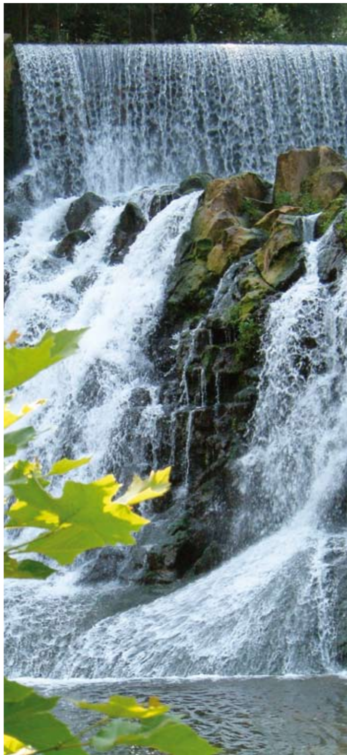
Salt d'aigua Molí Fondo

Molí Fondo és també el nom que es va donar a l'antiga fàbrica paperera que es pot veure en aquest indret i que va ser l'origen de la Torras Papel que es coneix actualment.